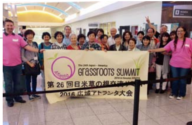
アトランタ空港でボランティアに迎えられた参加者 Atlanta volunteers welcomed participants at airport

From Japan, participants arrived at Hartsfield-Jackson Atlanta International Airport via different routes, via Seattle, via Minneapolis and on direct flights. At the airport participants were greeted by many welcoming faces of members of the co-organizer, Japan-America Society of Georgia.