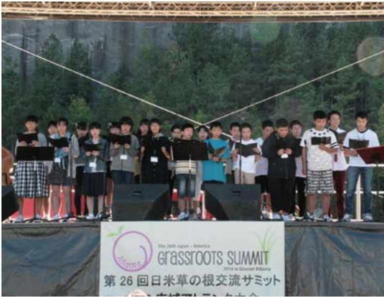
Chorus performance by Fukushima students from Katsurao and Kawauchi