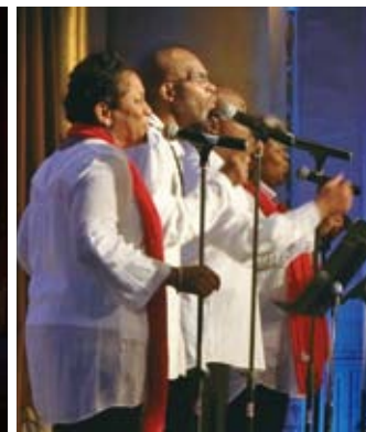
ゴスペル・パフォーマンス・グループ Gospel performance group