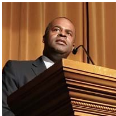
カシム・リード アトランタ市長 Kasim Reed, Mayor of City of Atlanta