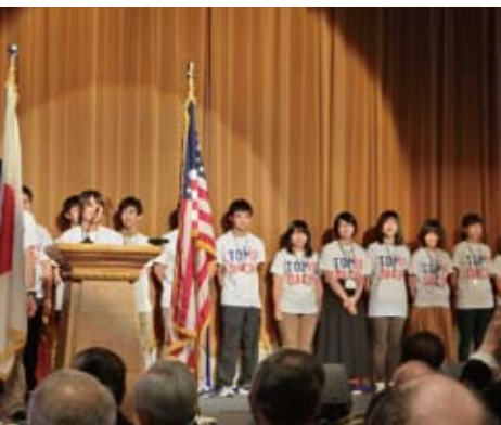
大分上野丘高校化学部生徒による自己紹介 Self-introduction of Oita Uenogaoka High School students