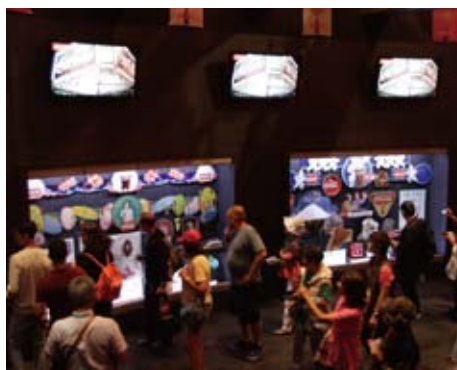
ワールド・オブ・コカ・コーラ見学 World of Coca Cola

The "Golf Outing" course. Seven participants from Japan enjoyed a round of golf with members of the Japan America Society of Georgia at the East Lake Golf Club, where the PGA Championship, in which Matsuyama Hideki took part, had just been held.