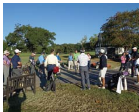
ゴルフ場にて At the East Lake Golf Club