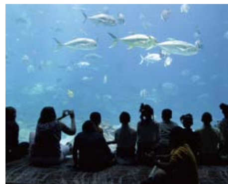
ジョージア水族館見学 Georgia Aquarium