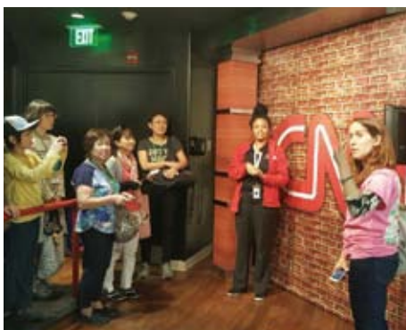
CNNセンターでスタジオ見学 CNN Center