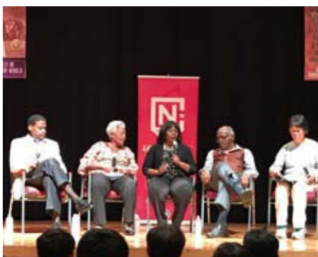
キング牧師子孫による証言 Testimonies by desendants of MLK