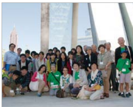
人権センターにて Center for Civil and Human Rights