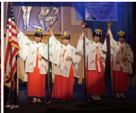
川内中学校生徒による浦安の舞 Shinto Kagura performance by students of Kawauchi Junior High School