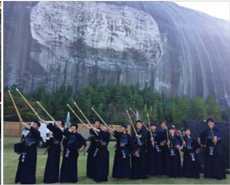
Kendo demonstration by Katsurao Junior High School students