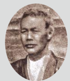
ジョン(中濱)万次郎 John Manjiro Nakahama